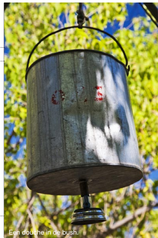
Een douche in de bush.

2x • Maun is een aangename plek om enkele nachten te verblijven voor/na een rangercursus. Je vindt er veel prettig geprijsde accommodaties, zoals de Okavango River Lodge . Deze relaxte lodge ligt direct aan een rivier en biedt o.m. zwembadje, tuinen, bootexcursies en een fijn restaurant. 2-pk v.a. € 35, tent € 12 pp. Info: www.okavango-river-lodge.com . • Er is zelfs een Nederlandse B&B in Maun: Discovery B&B , even buiten het stadje, 2-pk v.a. € 53. Zie: www.discovery-bedandbreakfast.com