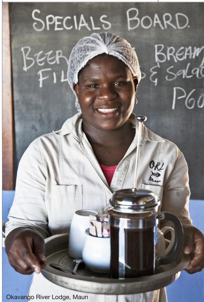
Okavango River Lodge, Maun